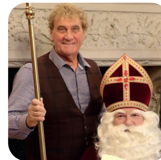
Jean-Marie Pfaff Voormalig doelman