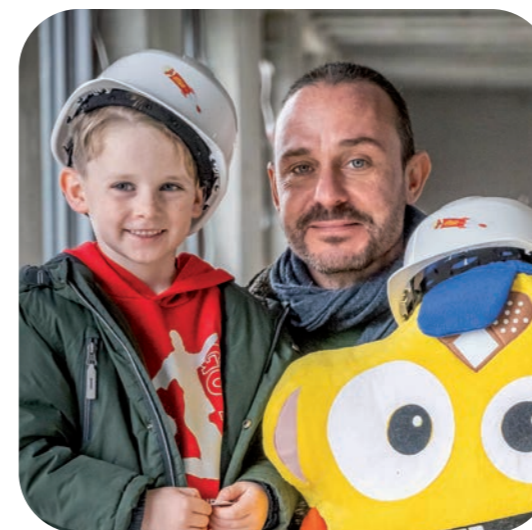
Tijs Vanneste Belgische zanger, tv-presentator en tattoo artist

Om de bekendheid van Planeet Goudgeel te vergroten, doet Dimpnafonds een beroep op haar ambassadeurs. Ze zetten zich in om met hun bekendheid het project onder de aandacht te brengen. De ambassadeurs doen dit volledig op vrijwillige basis.